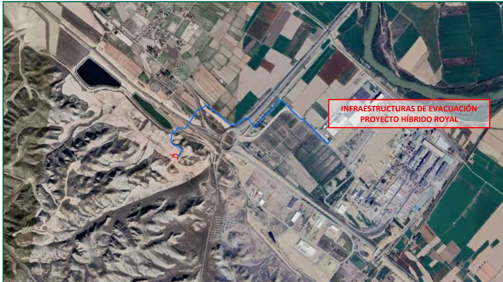
Recreación paisajística 2. Vista aérea de las Infraestructuras de evacuación Proyecto Híbrido Royal.