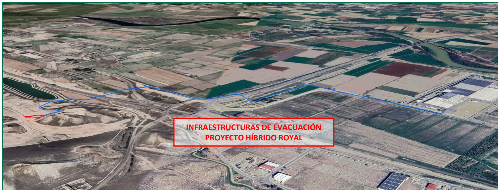
Recreación paisajística 3. Vista aérea de las Infraestructuras de evacuación Proyecto Híbrido Royal, desde el sur.