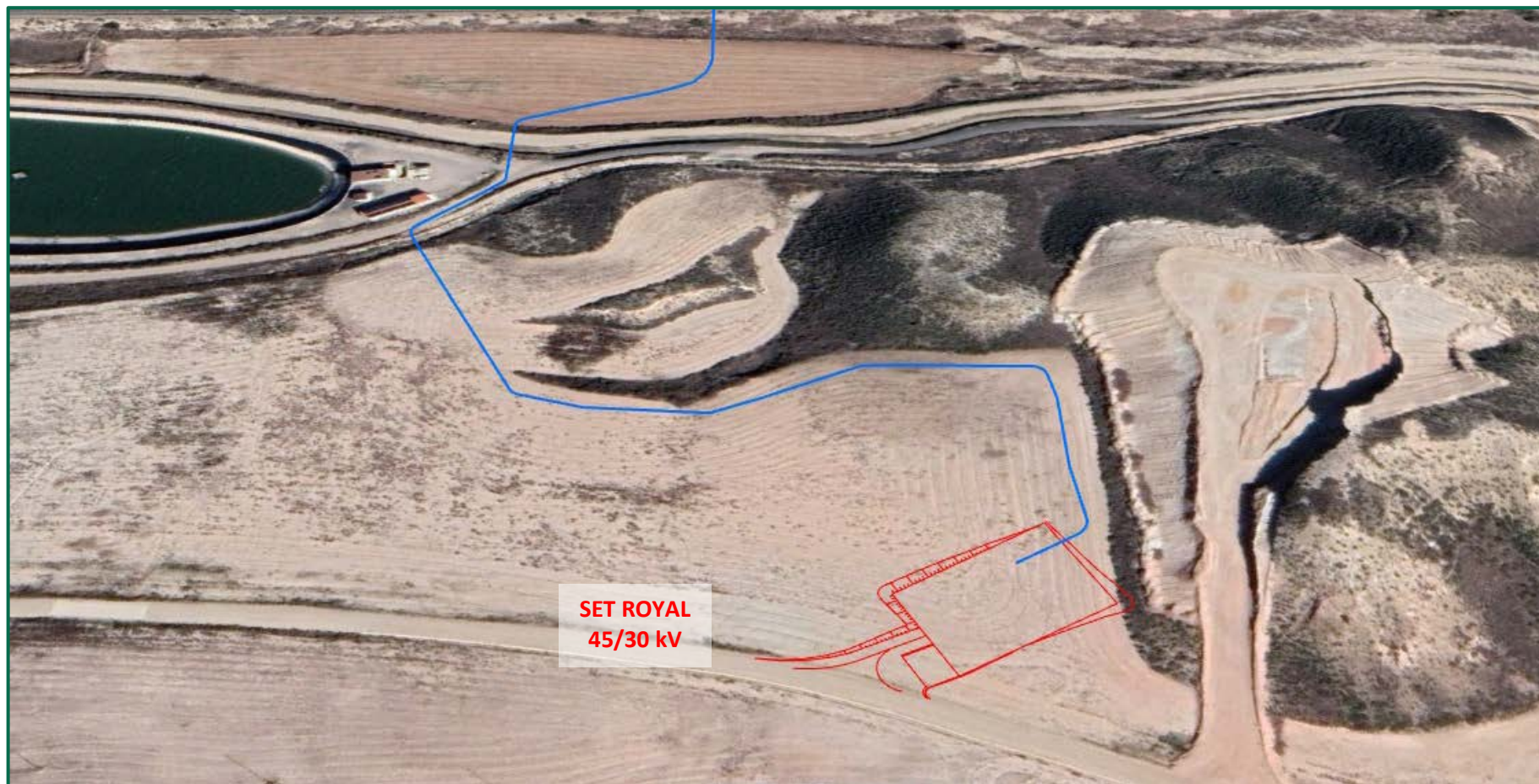
Recreación paisajística 7. Vista aérea de las Infraestructuras de evacuación Proyecto Híbrido Royal, en detalle SET ROYAL y comienzo de la línea soterrada.