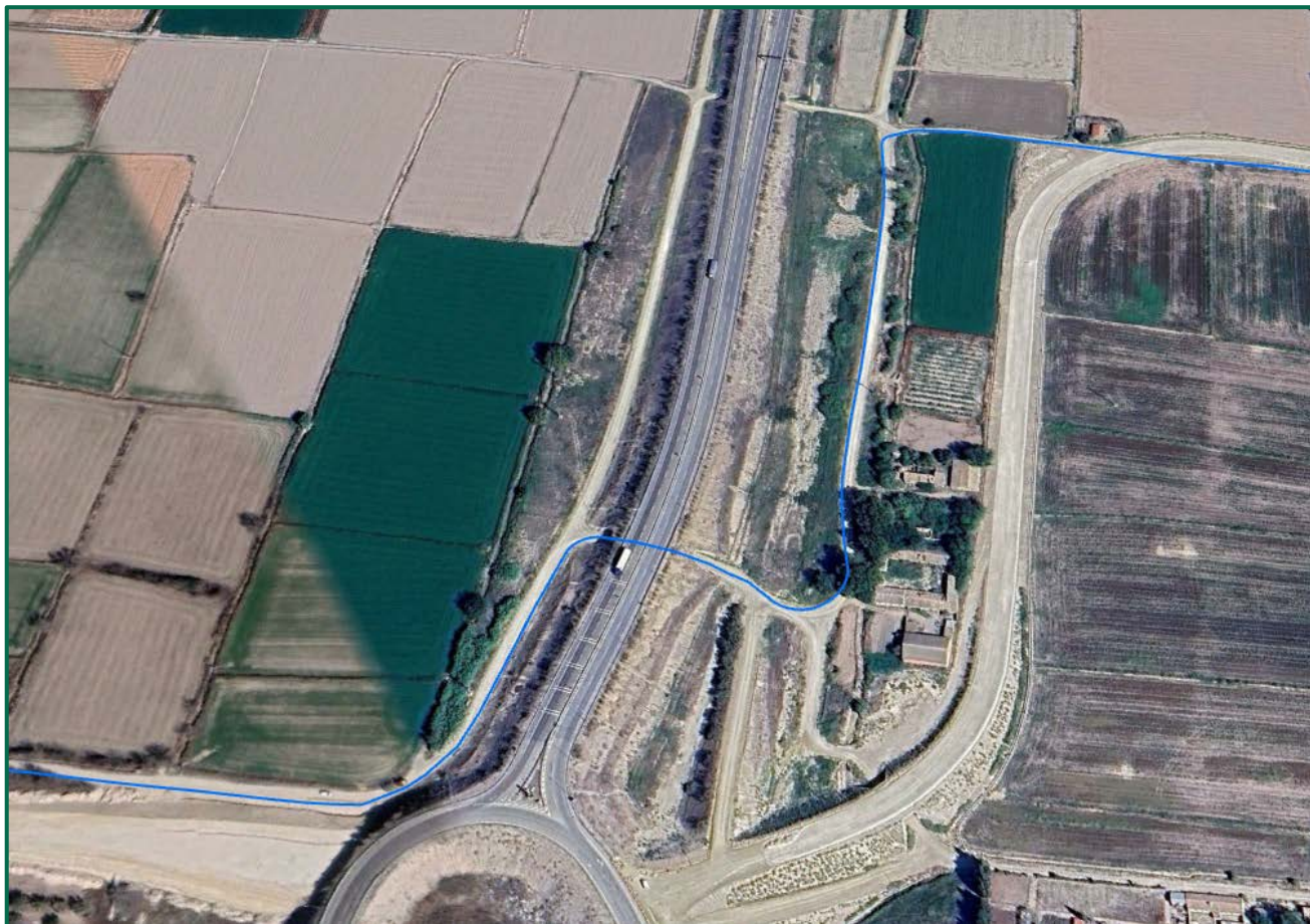
Recreación paisajística 9. Vista aérea de las Infraestructuras de evacuación Proyecto Híbrido Royal, en detalle cruce de la línea soterrada con carreteras de conexión entre A2 y N232.