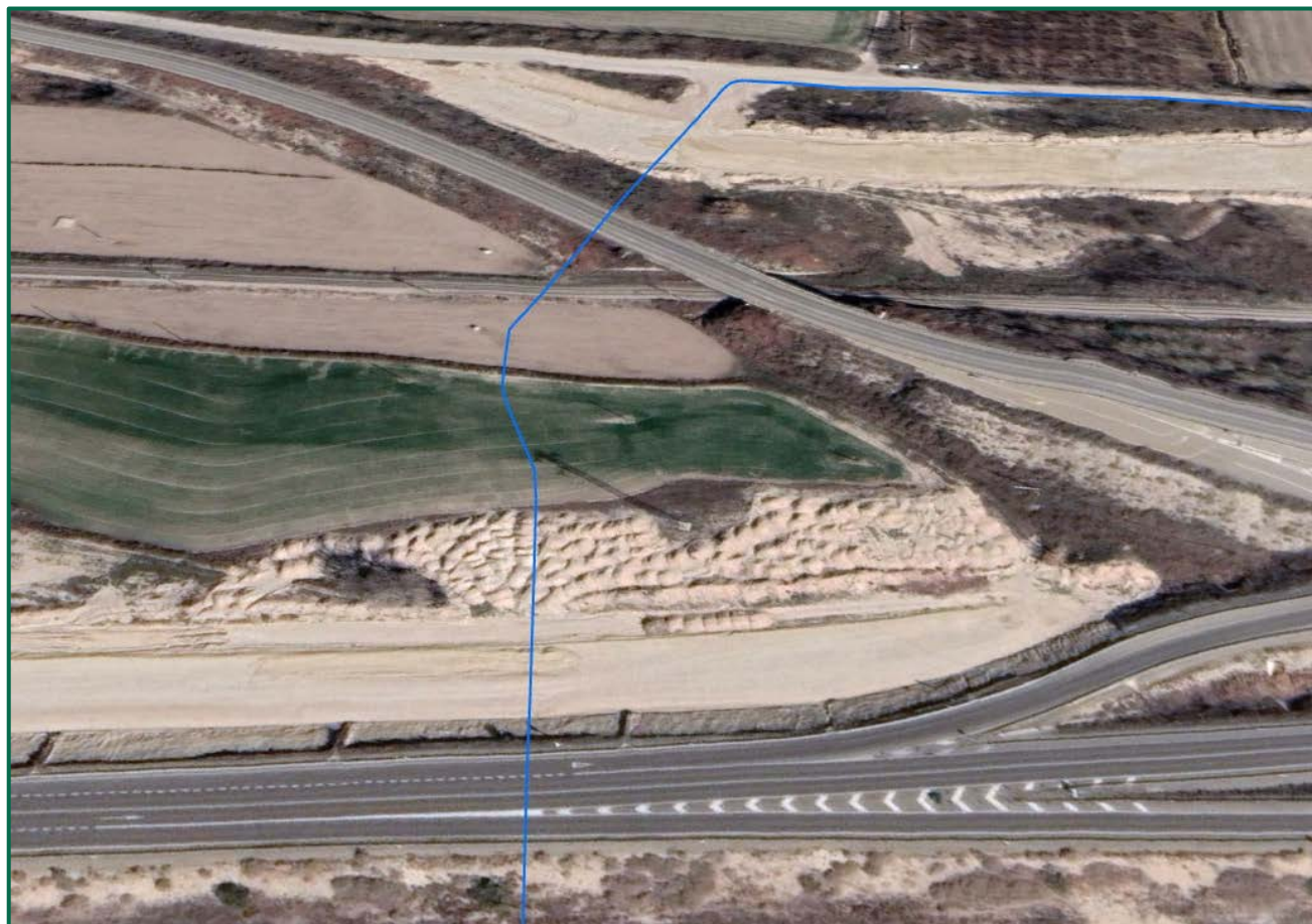
Recreación paisajística 8. Vista aérea de las Infraestructuras de evacuación Proyecto Híbrido Royal, en detalle cruce de la línea soterrada con carretera N232, ramales de acceso a esta y vías de ferrocarril.