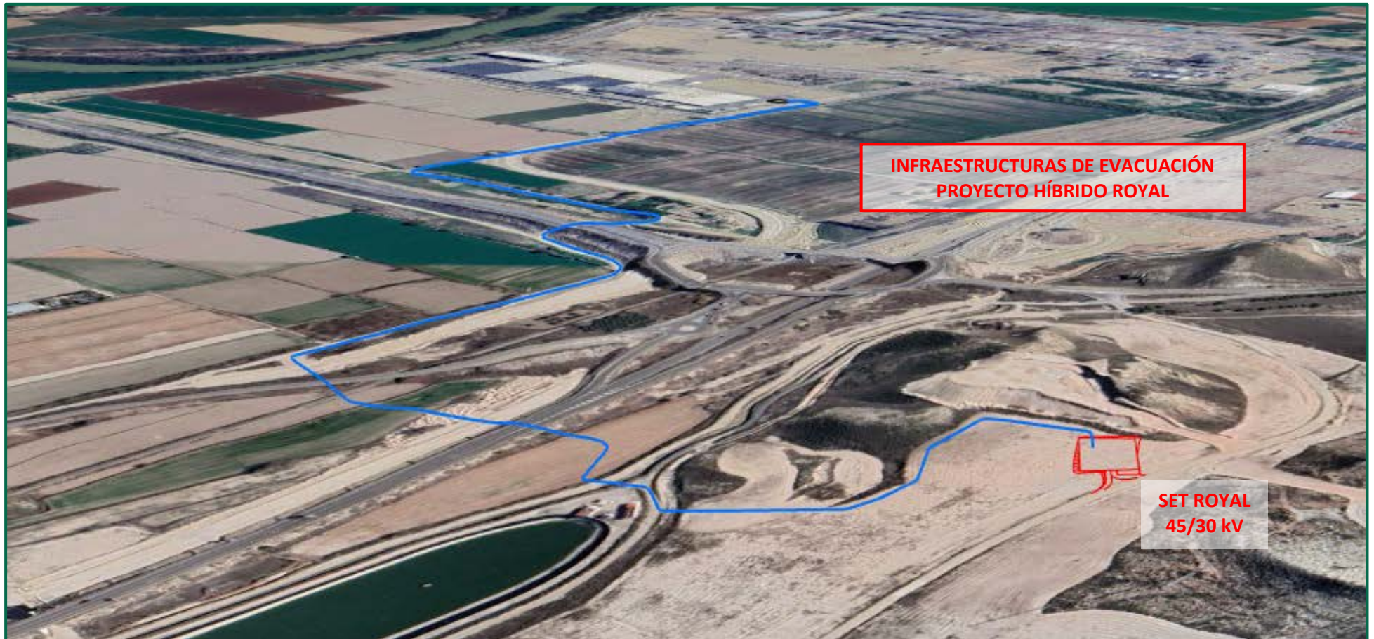
Recreación paisajística 6. Vista aérea de las Infraestructuras de evacuación Proyecto Híbrido Royal, desde el oeste.