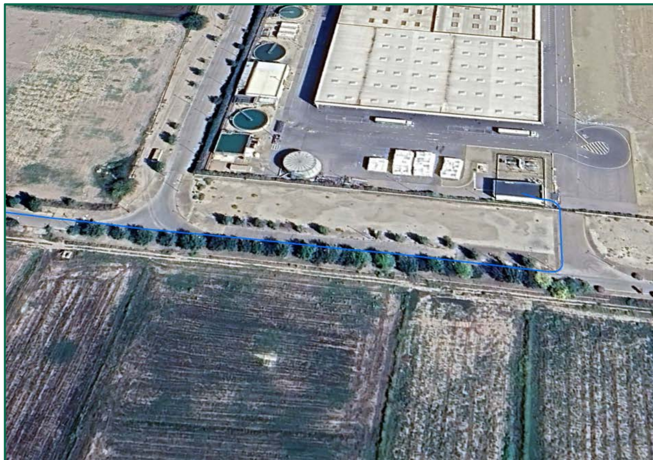
Recreación paisajística 10. Vista aérea de las Infraestructuras de evacuación Proyecto Híbrido Royal, en detalle Llegada de la línea soterrada a SET Tronchetti.