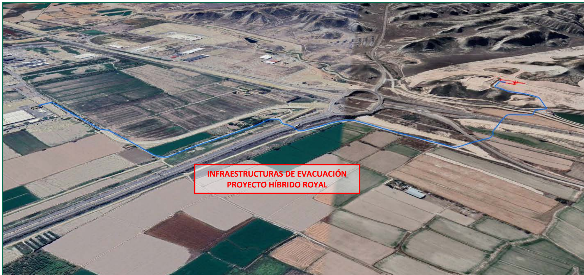
Recreación paisajística 5. Vista aérea de las Infraestructuras de evacuación Proyecto Híbrido Royal, desde el norte.