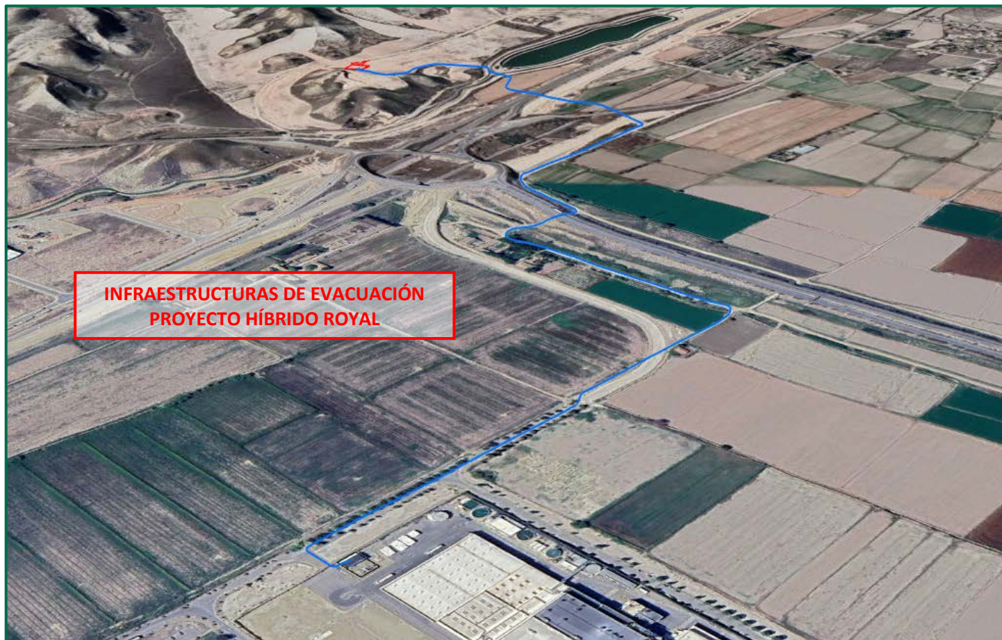
Recreación paisajística 4. Vista aérea de las Infraestructuras de evacuación Proyecto Híbrido Royal, desde el este.